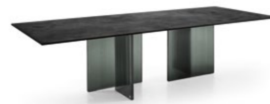
Table with base made of four or six separate 30 mm DV Glass elements with colored stripes. Tempered top made of 15 mm transparent glass, back-lacquered with monochrome colors or hand-finished with Ecomalta, finergrained texture finish, or in Canaletto walnut veneered wood, Tabacco finish.

Tavolo con base composta da quattro o sei elementi in DV Glass da 30 mm a strisce colorate. Piano temperato in vetro da 15 mm trasparente retroverniciato con tinte monocromatiche, oppure ricoperto in Ecomalta, spatolatura tipo fine, oppure in legno impiallacciato noce canaletto finitura Tabacco.