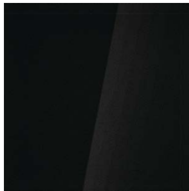
vetro extralight retroverniciato nero black back-painted extralight glass