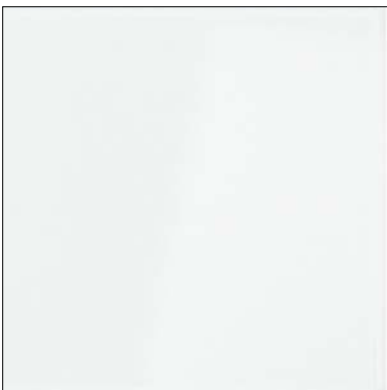
vetro extralight acidato retroverniciato bianco white back-painted and etched extralight glass