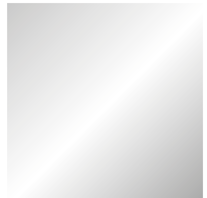
vetro extralight retroargentato extralight back-silvered glass